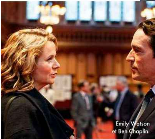
Emily Watson et Ben Chaplin.